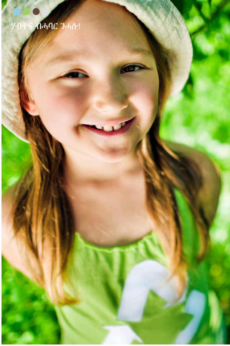
ሃብትና ብሓባር ንሓሉ!