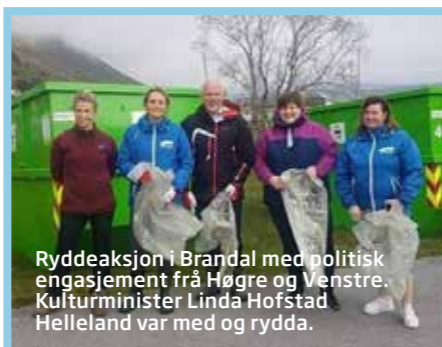
Ryddeaksjon i Brandal med politisk engasjement frå Høgre og Venstre. Kulturminister Linda Hofstad Helleland var med og rydda.