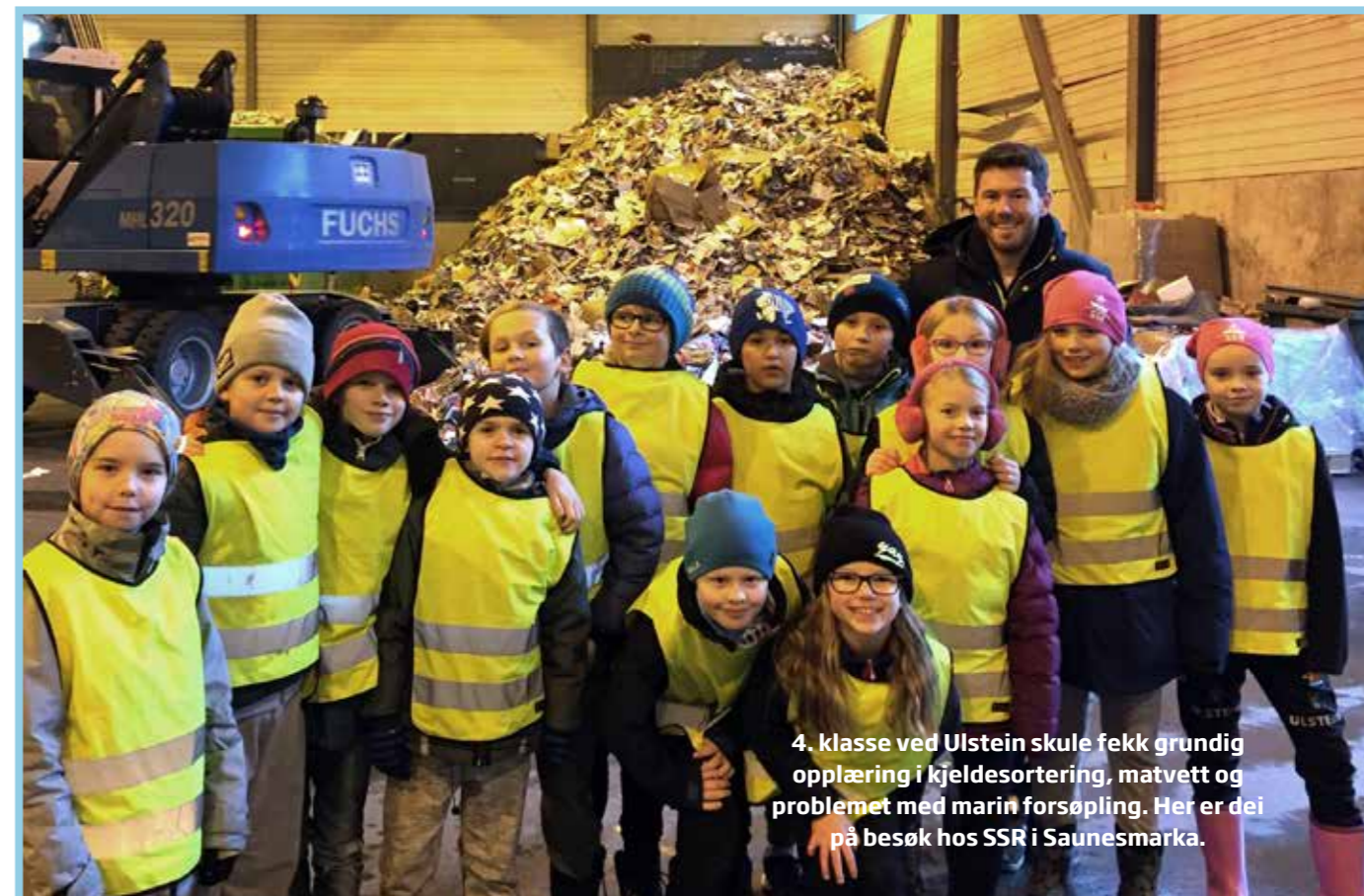
4. klasse ved Ulstein skule fekk grundig opplæring i kjeldesortering, matvett og problemet med marin forsøpling. Her er dei på besøk hos SSR i Saunesmarka.