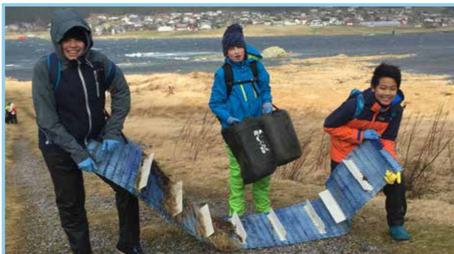
Elevlar frå Herøy kommune var kjempeflinke strandryddarar!

SSR takkar alle involverte for innsatsen og inviterer til ny dugnad våren 2018!