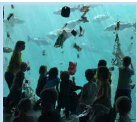
Arrangement på Atlanterhavsparken.