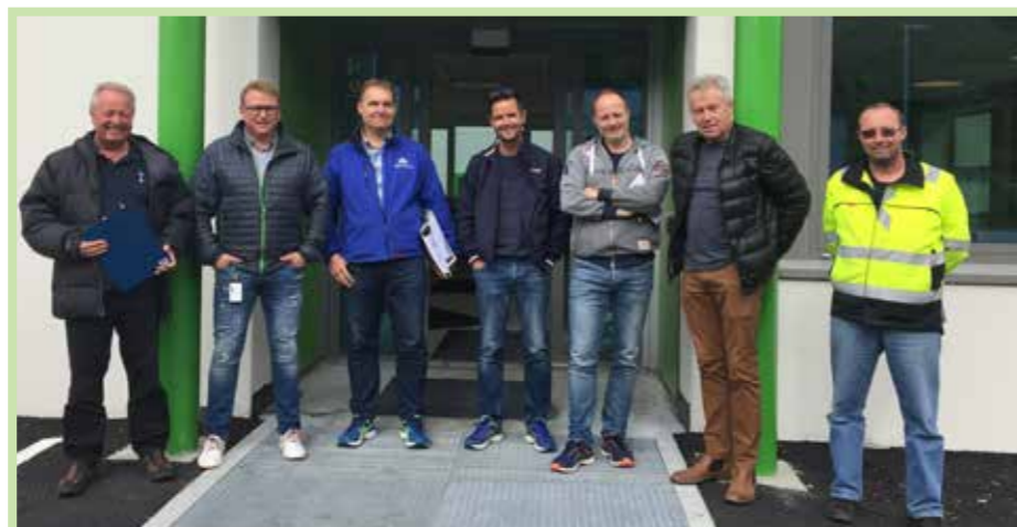
Utbyggerane av Saunesmarka samla for overtaking av bygg.

Ei svært positiv endring både for kundar og tilsette!