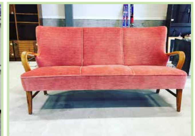
Ein kan gjere mange gode kupp på gjenbrukstorge i Saunesmarka!