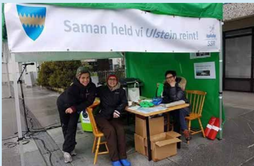
Linn frå SSR og Zari og Asbjørg frå Ulstein kommune.

SSR besøkte og fekk besøk av mange skular, barnehagar og grupper i 2017. Heile 17 skuleklasser, 13 barnehagegrupper og 11 grupper med asylsøkjjarar, speidarar og andre, fekk lære meir om kjeldesortering, marin forsøpling, matsvinn og andre aktuelle miljøspørsmål.