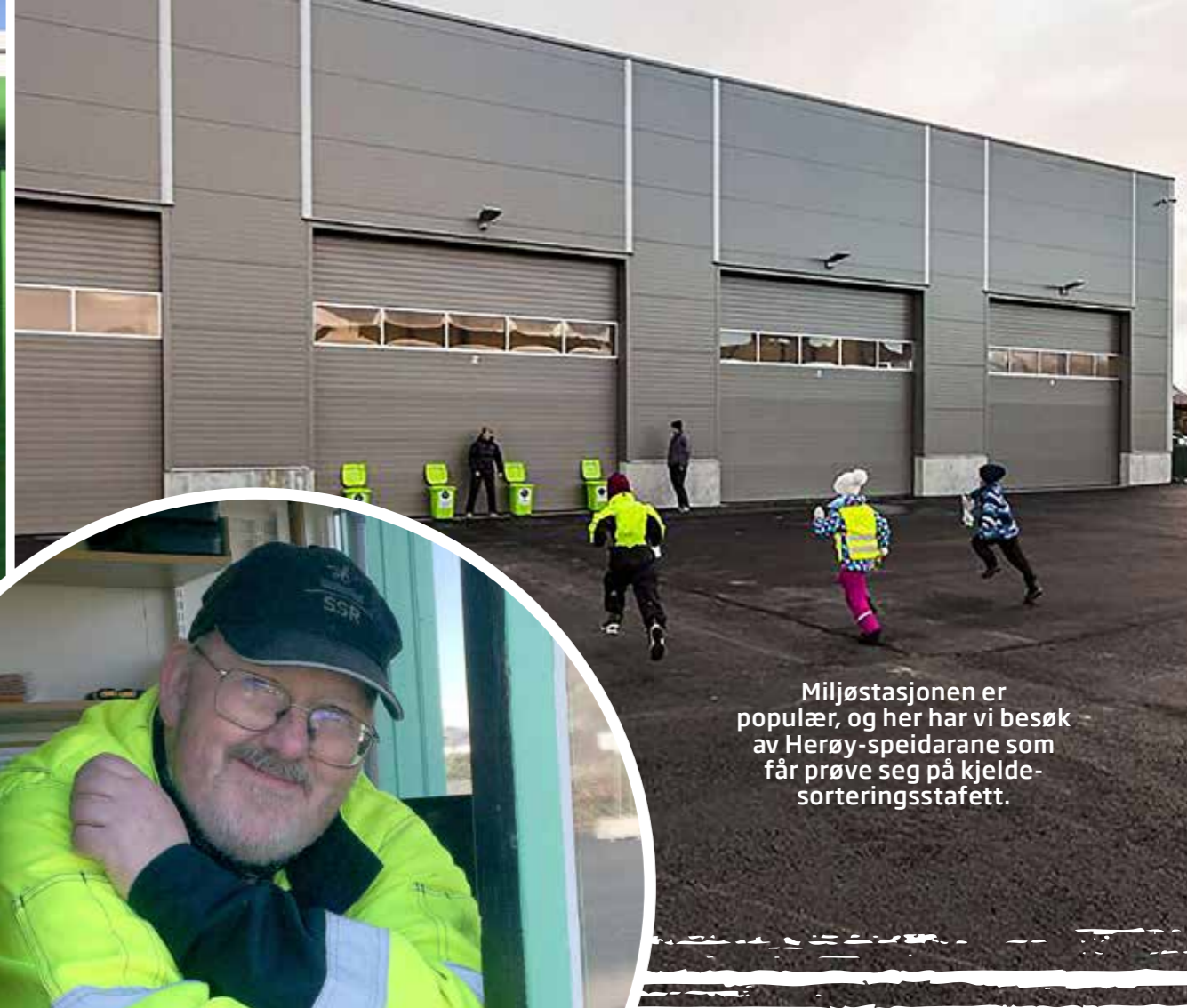
Miljøstasjonen er populær, og her har vi besøk av Herøy-speidarane som får prøve seg på kjelde-sorteringsstafett.