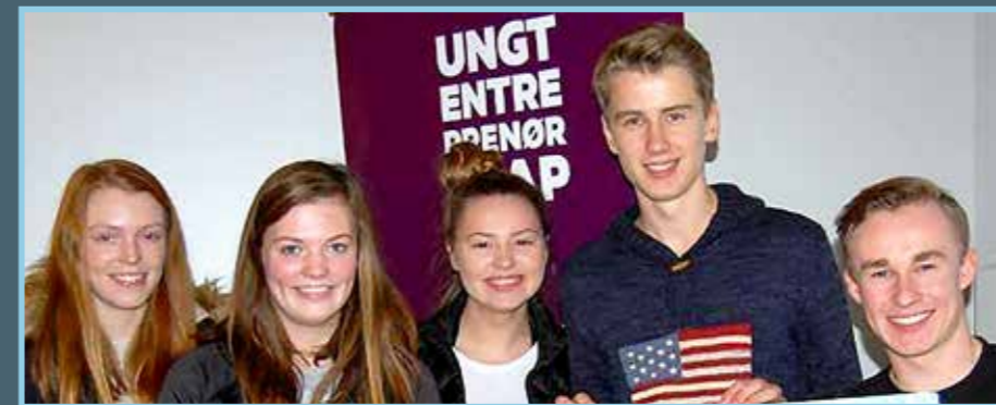
Vinnarane av Innovasjonscamp 2016 ved Ulstein vidaregåande skule.

SSR var oppdragsgjevar både for innovasjonscamp på Ulstein ungdomsskule og Ulstein vidaregåande skule.