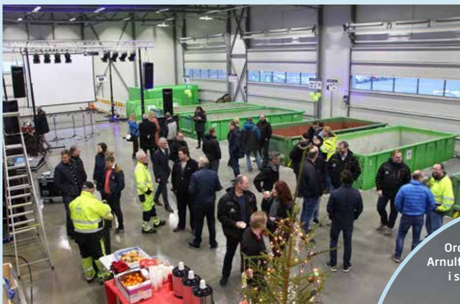
Gjestar på opninga av miljøstasjonen.

9. desember 2016 opna den nye, flotte og framtidsretta miljøstasjonen på Mjølstadneset i Herøy kommune.