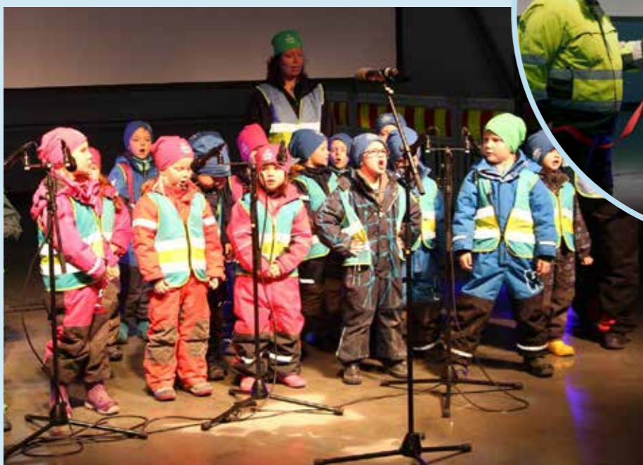
Born frå Trollmyra barnehage sang og sjarmerte på opninga.

Eit stort løft i tenestetilbodet til Herøyværingane! Miljøstasjonen har innandørs hall som rommar dei fleste fraksjonar. Miljøstasjonen har også fått vekt og utvida opningstider med open stasjon kvar kvardag og nokre laurdagar.